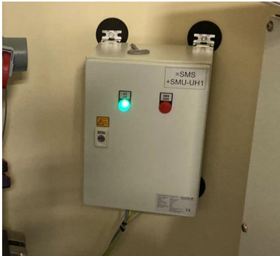
Abbildung 11-1: SMU4 Modul des Schattenwurfschutzsystem

Die SMU des Schattenwurfschutzsystem, welches in einem Schaltschrank mit der Schutzklasse IP 65 eingebaut ist, wird im Turmfuß der WEA angebracht.-Das Modul wird in der Regel in der Master-WEA am Standort untergebracht.